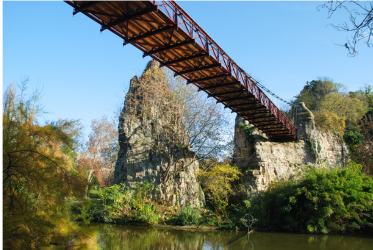
Parc des Buttes Chaumont

Saviez-vous que la Tour Eiffel avait une cheminée ? Avant de passer à l'électricité, les ascenseurs de la Dame de Fer ont été alimentés pendant une dizaine d'années par des machines à vapeur, les fumées étaient évacuées par un conduit menant à cette cheminée haute de 12,50 mètres. On aperçoit ses briques entre les arbres près du pilier ouest.